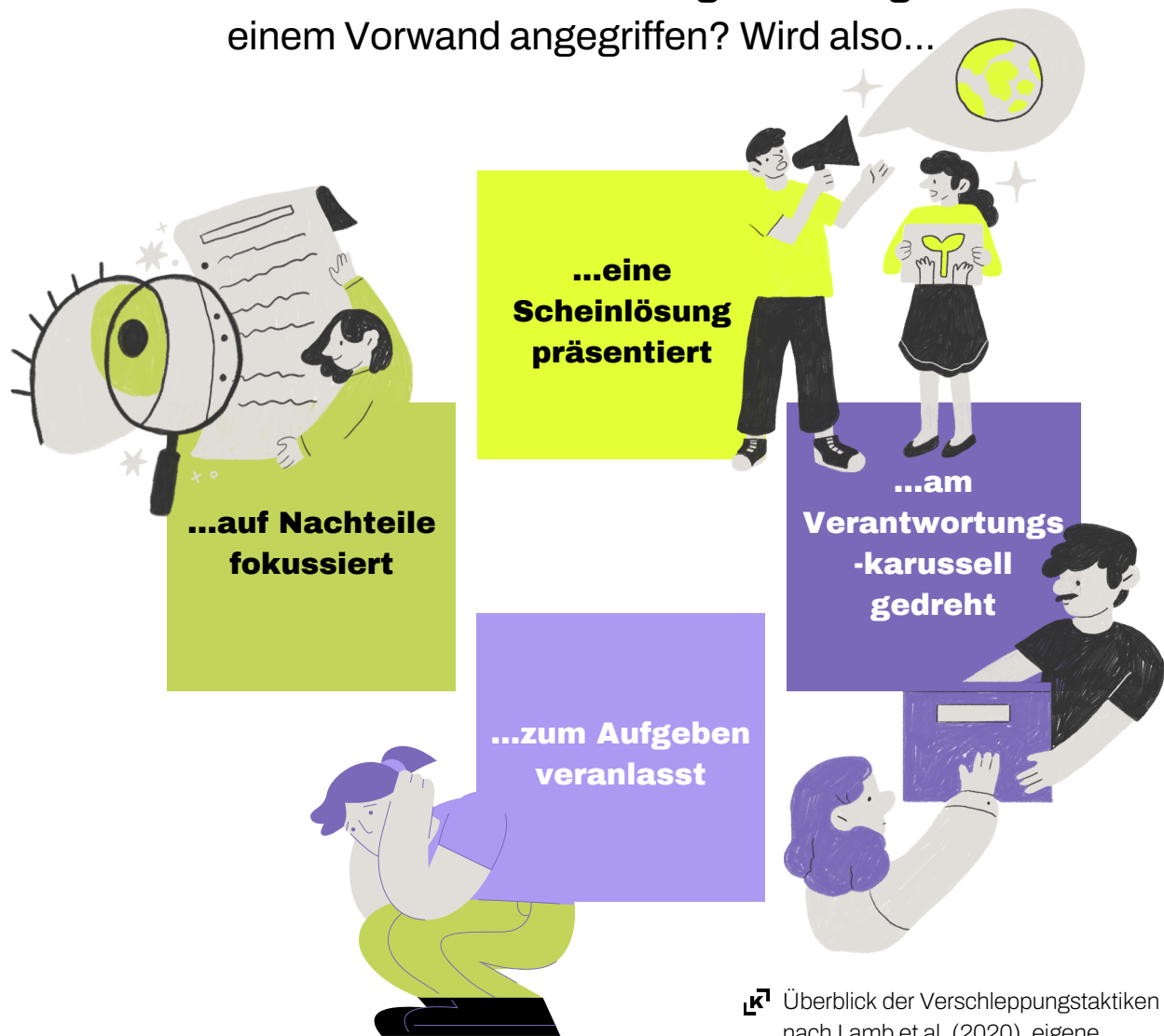
Überblick der Verschleppungstaktiken nach Lamb et al. (2020), eigene Darstellung